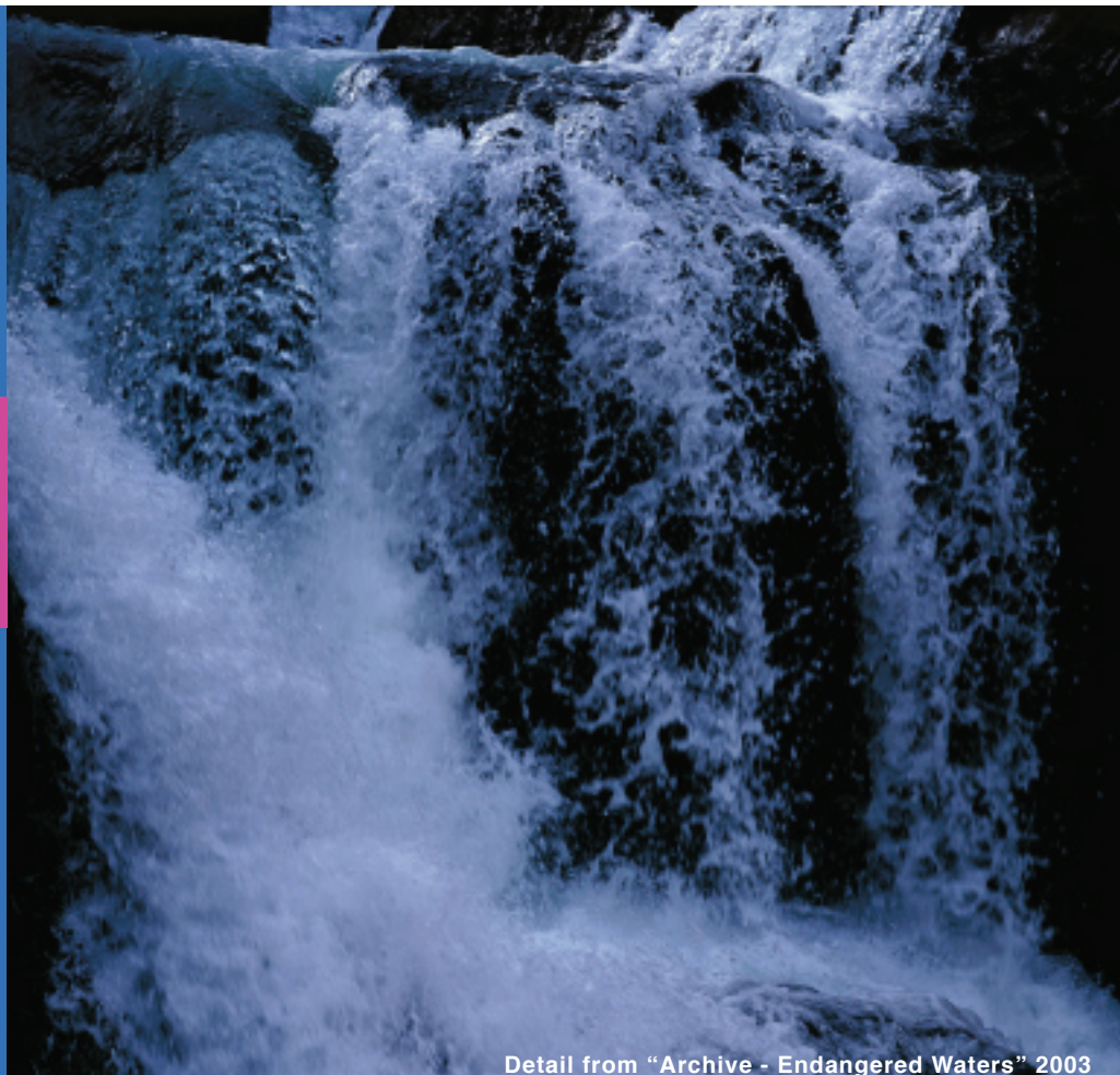
Detail from "Archive - Endangered Waters" 2003

Mittwoch, 22. Oktober bis Montag 27. Oktober 2008